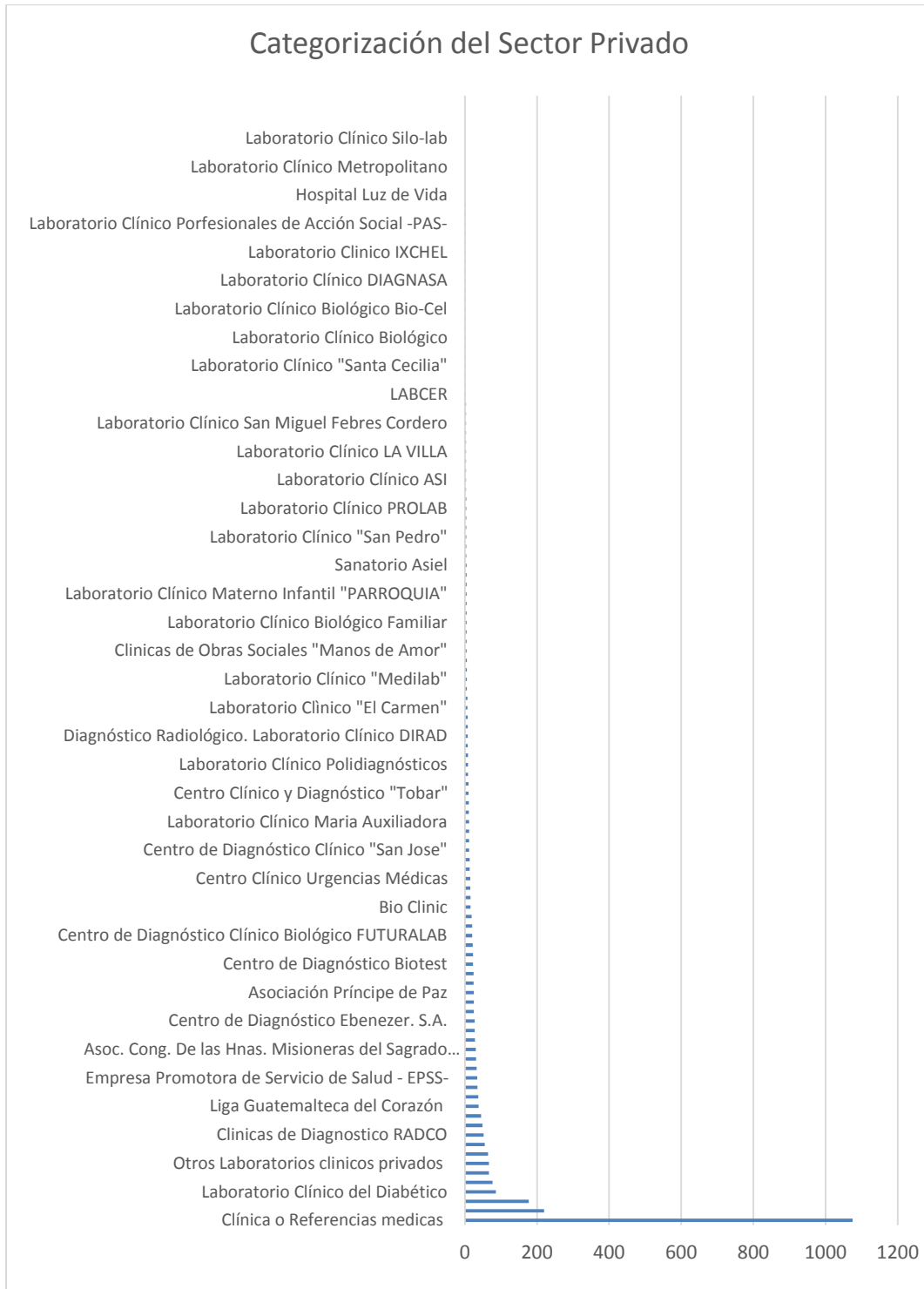
Gráfica 3. Categorización de establecimientos de salud del Sector Privado