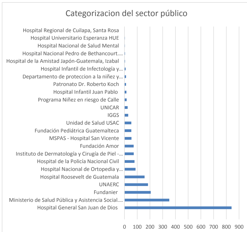
Gráfica 2. Categorización de establecimientos de salud del Sector Público